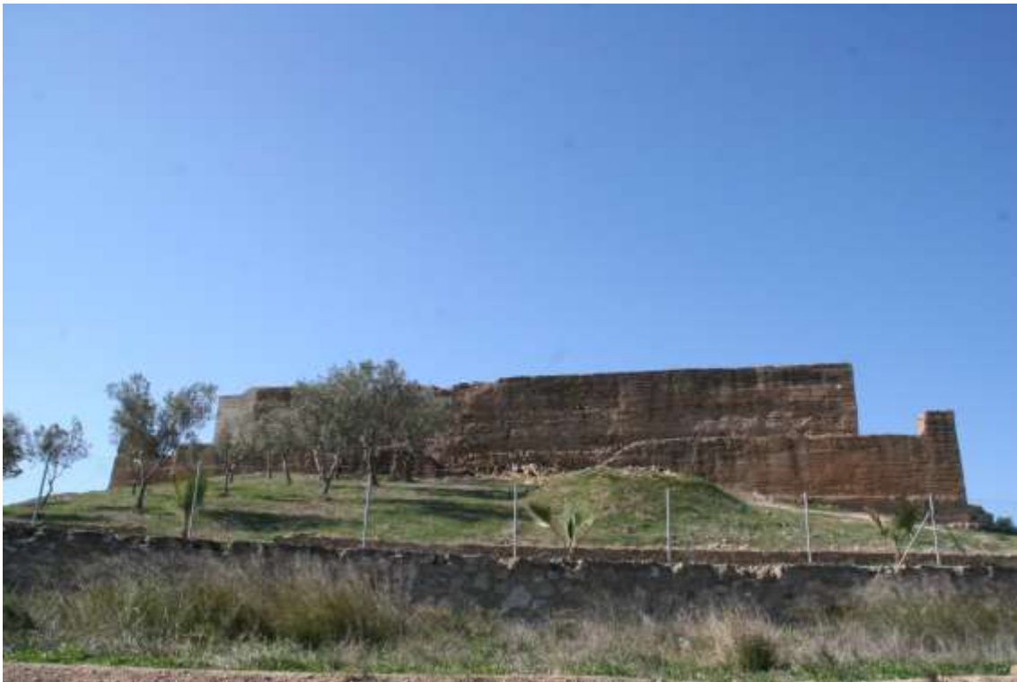
Vista general del Castillo de Larache.