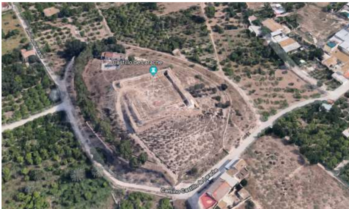
Vista aérea del Castillo de Larache.