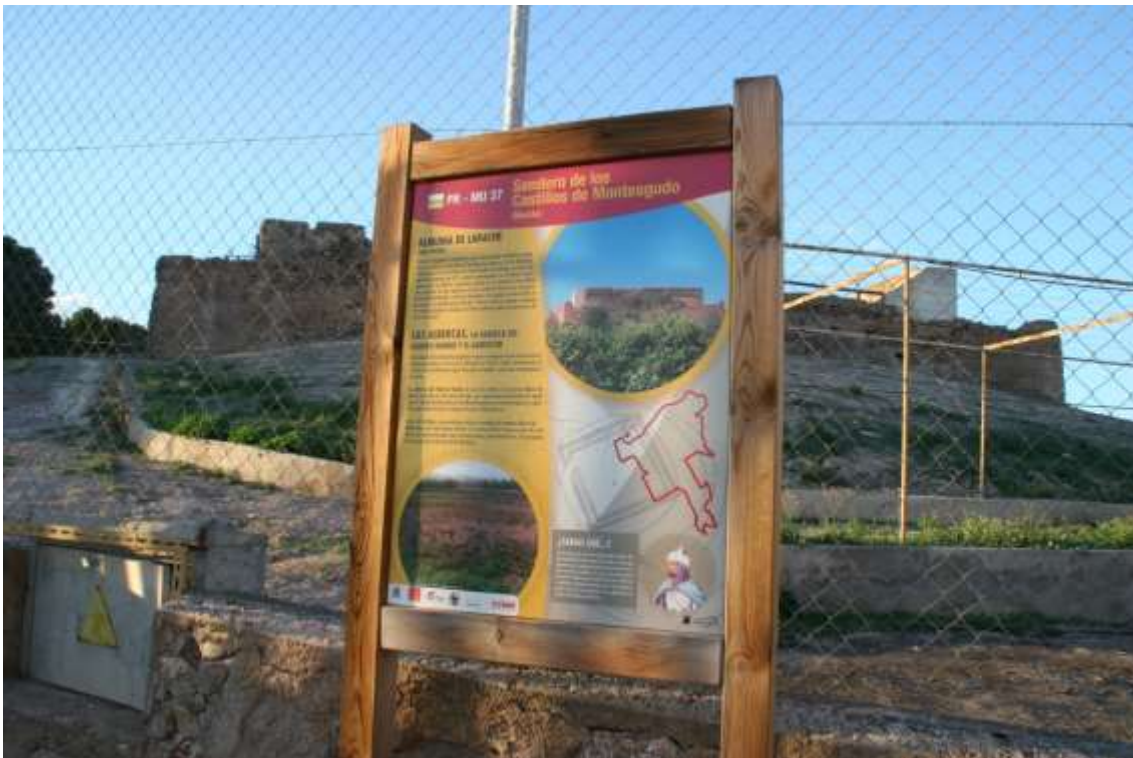
Cartel de información sobre el castillo, pero no se aprecia explicación alguna sobre el funcionamiento de visitas al BIC.