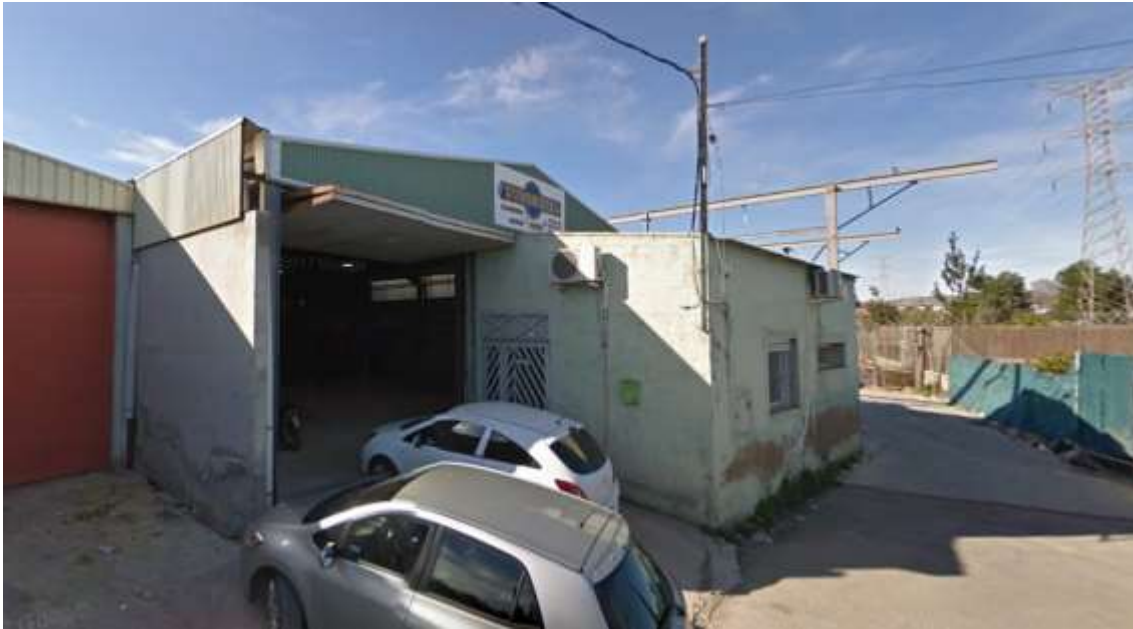
Edificaciones y naves industriales dentro del Sitio Histórico de Monteagudo-Cabezo de Torres (BIC).