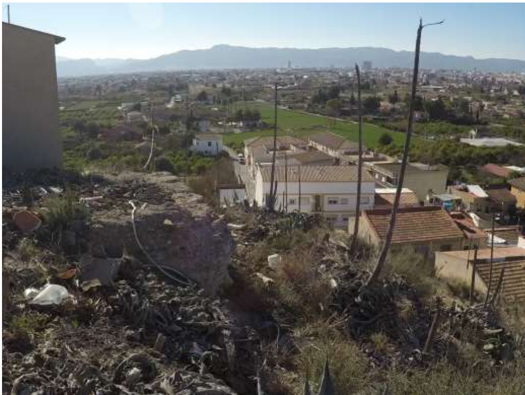
Detalle de una de las torres defensivas del Castillo, totalmente ocultada bajo la basura y maleza.