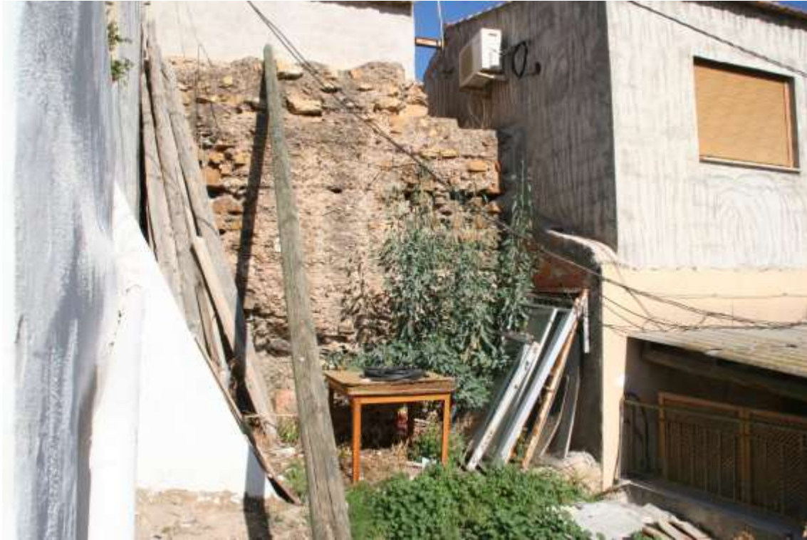
Muros del castillo atrapados entre las viviendas que se han ido construyendo de forma totalmente irregular alrededor del monumento y sobre el mismo.