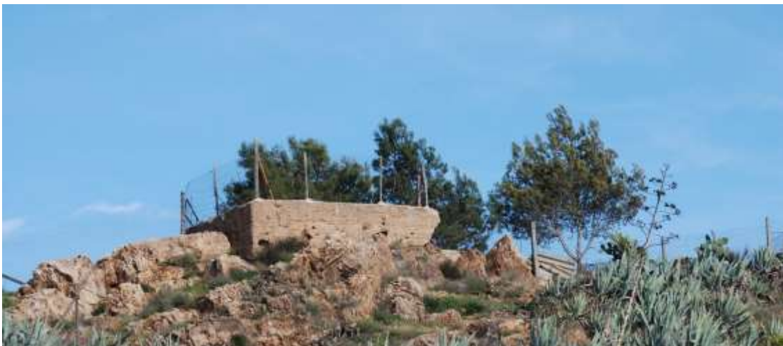
Vista de la parte superior del castillo sobre la colina del Cabezo.