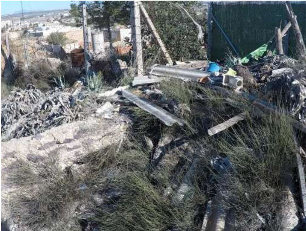
El castillo acumula gran cantidad de escombros y restos de fibrocemento (uralitas).